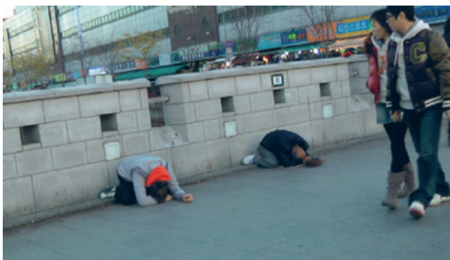
I Live My Life in Art, 2011