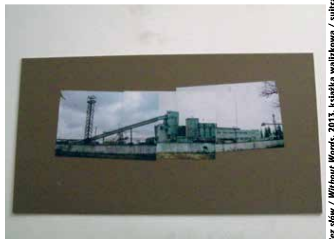
Bez słów / Without Words, 2013, książka walizkowa / suitcase-book