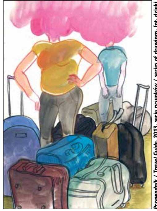
Przewodnik / Travel Guide, 2013, seria rysunków / series of drawings