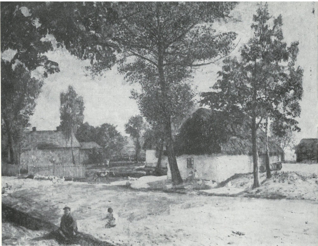
Na wiejskiej drodze