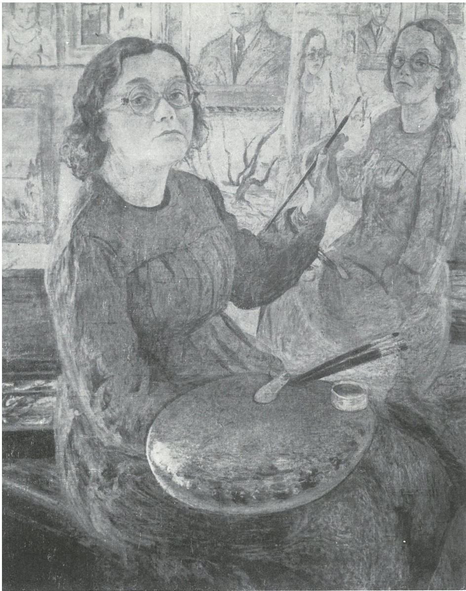
Autoportret z paletą

związek polskich artystów plastyków centralne biuro wystaw artystycznych