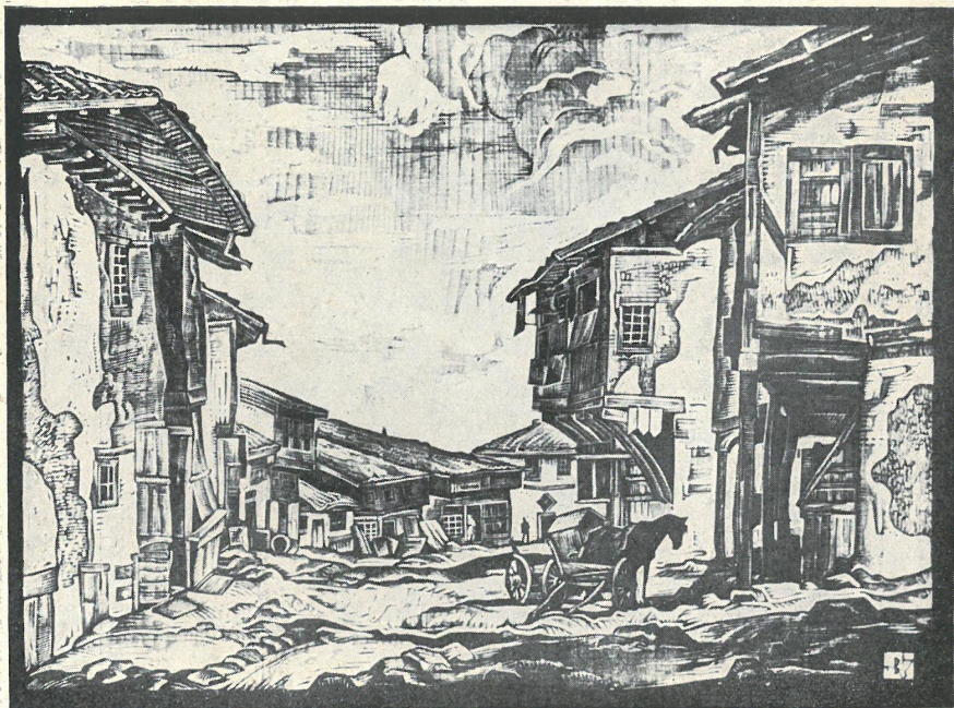
Wasył Zacharijew. Stary rynek w Samkowie