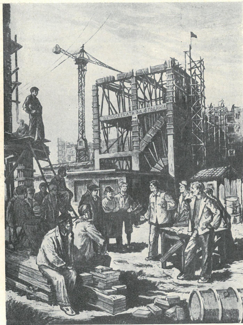
J u l i M i n c z e w. Na budowie