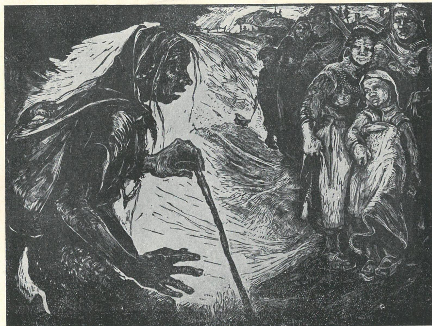
Binka Wazowa. Stara żebraczka