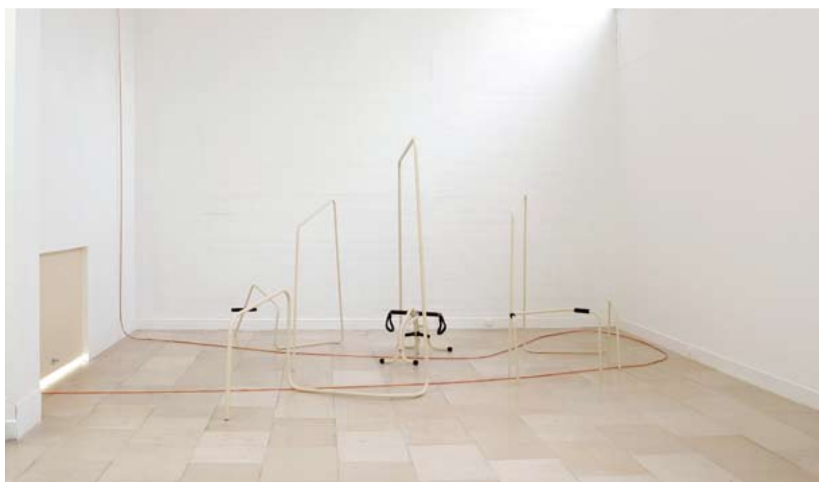
Tatiana Trouvé Polder , 2007, dzięki uprzejmości artystki i Galerie Perrotin, Paryż; fot. Jean Brasille

Hasła opracowane na podstawie: Słownik terminologiczny sztuk pięknych , Warszawa 2006; I. Chilvers, H. Osborne, Oksfordzki leksykon sztuki , Warszawa 2002.