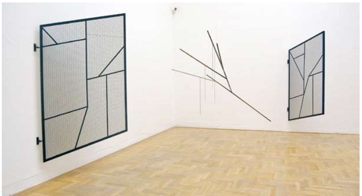
Martin Boyce We Are Fragile And Unstoppable. We Appear And Disappear , 2004 Where Shadows Dream of Light , 2010