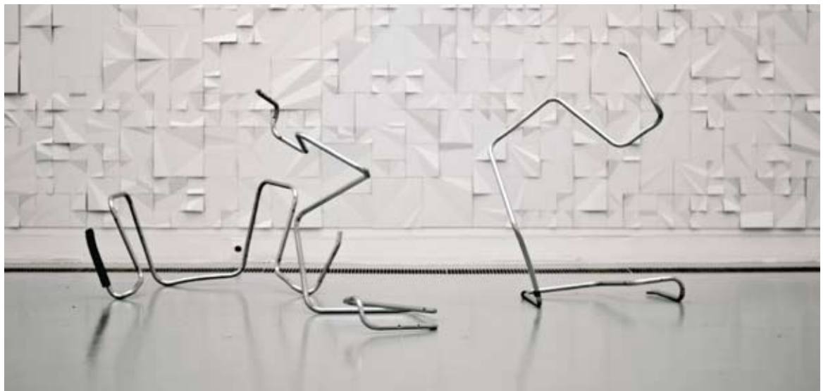
Wade Guyton Bez tytułu (Action Sculpture), 2003 Bez tytułu (Action Sculpture), 2003 Bez tytułu (Action Sculpture), 2011