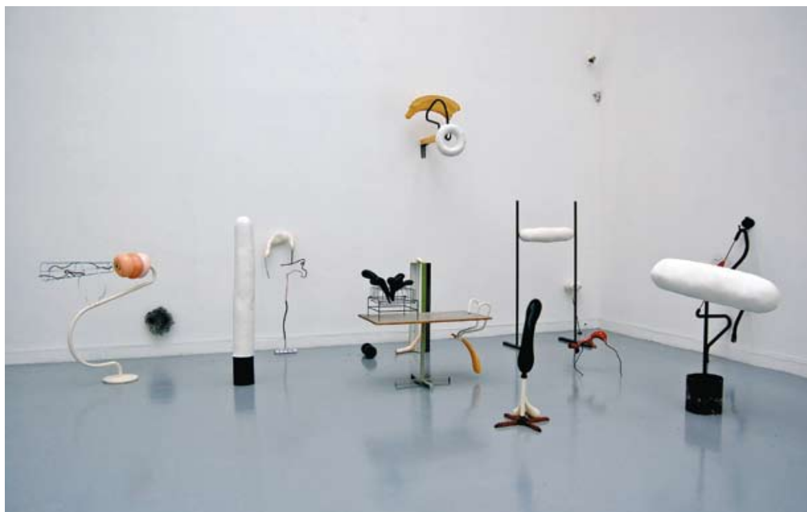
Prace Kasi Fudakowski

Prace Kasi Fudakowski to gotowe przedmioty (ready mades) uzupełnione formami z tworzywa sztucznego i gipsu. Jaka mogła być pierwotna funkcja tych przedmiotów? Które elementy rzeźb artystki moglibyście wykorzystać w domu? Co mogło inspirować ją do wykonania tych prac? Czy inspiracje mogły być podobne do tych, z których korzystali surrealiści (sny, formy baśniowe, fantastyczne)?