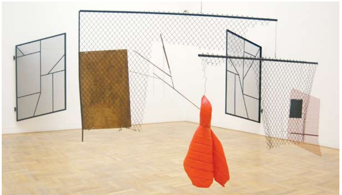
Martin Boyce We Are Fragile And Unstoppable. We Appear And Disappear, 2004 In Between Breaths and the Sodium Spill, 2004 Where Shadows Dream of Light, 2010

Znajdźcie na wystawie prace Martina Boyce'a. Od 2005 roku artysta pozostaje pod ogromnym wpływem pracy braci Jana i Joëla Martelów z 1925 roku, zatytułowanej Kubistyczne drzewa (na fotografiach w teczce). Tę typowo kubistyczną strukturę Boyce rozłożył na poszczególne kształty i formy, które stały się motywem przewodnim jego prac. W której z jego rzeźb możecie dostrzec ten motyw? Gdzie widać go najwyraźniej?