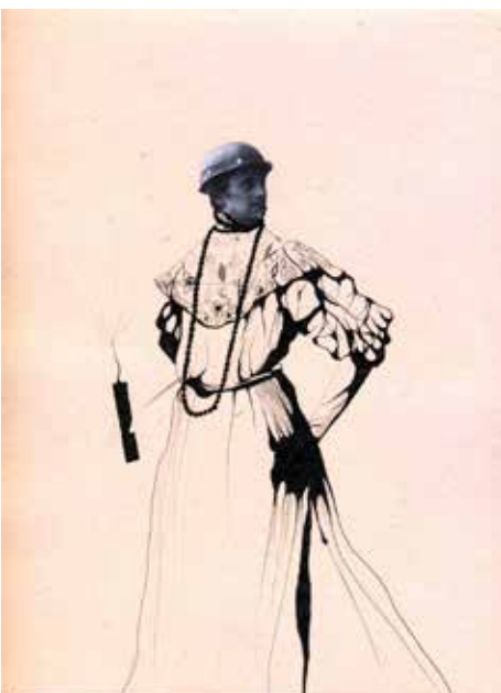
Szkoła rewolucjonistek schowana za piękną kamienicą / Revolutionary Girls' School Hidden Behind a Beautiful Tenement