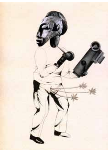
Przyszli do pracy z marihuaną. Ukrył ją w majtkach / Man Goes To Work With Weed in His Pants