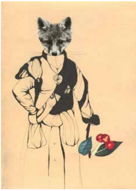
Słodka historia na Senatorskiej, cukiernia w domu zdrajcy / Sweet Sensation at Senatorska Street: Cake Shop at Traitor's Home