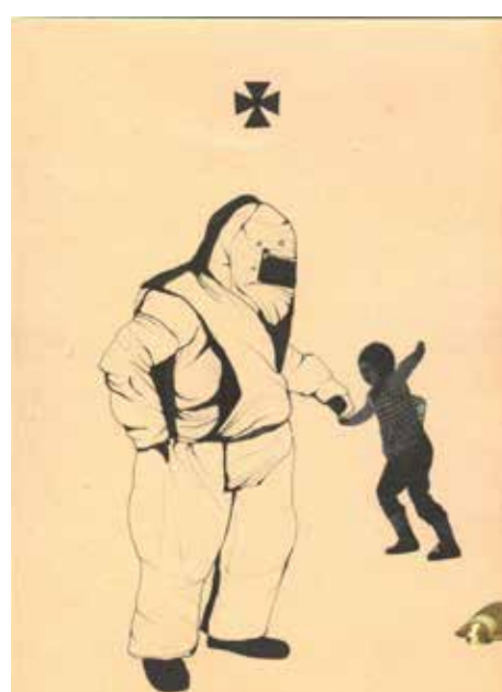
Strażnicy uratowali tonącą nastolatkę, dostali awans / Guards Save Drowning Teenager, Get Promoted