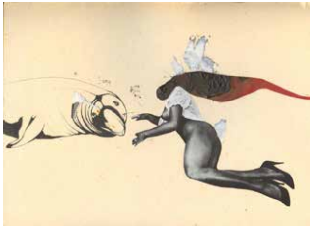
Podglądają przez kamery, widzą rozboje, seks w fosie / Security Cameras Show Sex And Violence In Moat