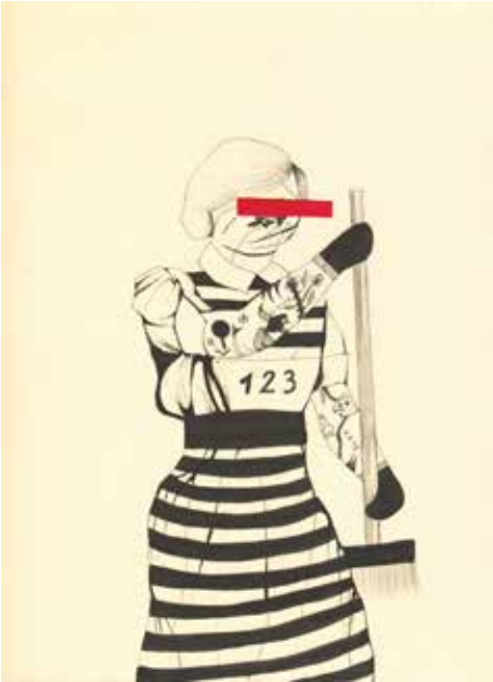
Więźniarki sprzątają ulice. Miasto oszczędza 500 tys. zł / Female Inmates Clean Streets, City Saves 500 K