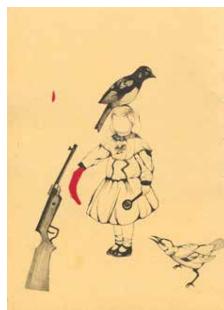
Postrzelili z wiatrówki 10-letnią dziewczynkę / 10 Year Old Girl Wounded by Airgun