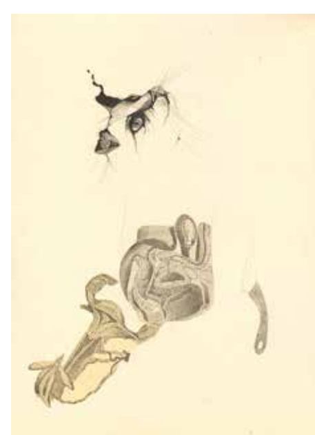
Przycinają kotom uszy. Barbarzyństwo. To dla ich dobra / Cats' Ears Trimmed. Barbaric. It's for Their Welfare