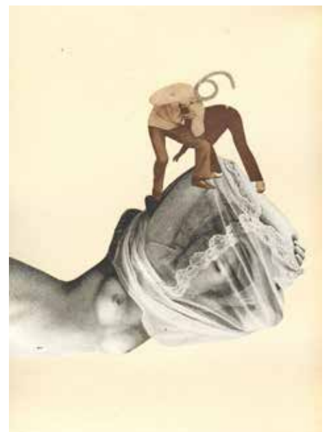
6 nastolatków skatowało koleżkę, poszło o dziewczynę / 6 Teenagers Beat Classmate over Girl