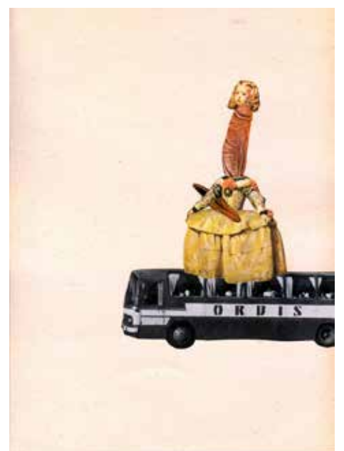
Kierowca autobusu do pasażerki j...na księżniczkę / Bus Driver Calls Passenger F... Princess