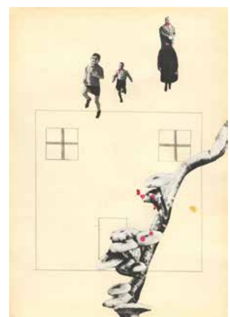
Morderstwa zlecane dla Willi Chimera / Murders Contracted for Villa Chimera