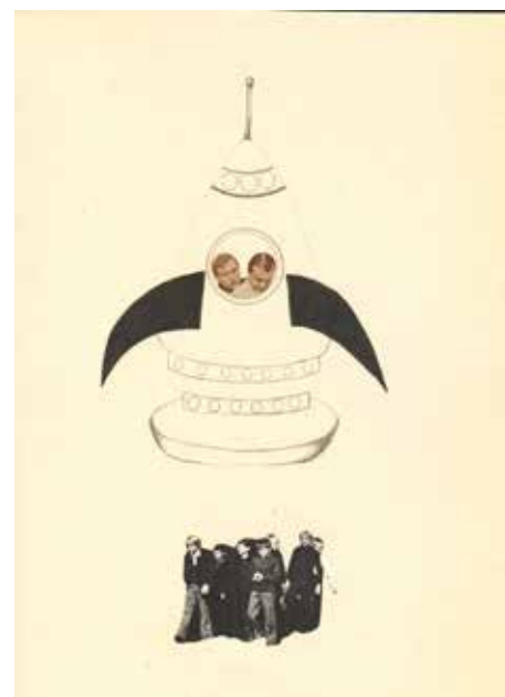
Dzieci, rakiety i talerze. Tak z nas żartują w Krakowie / Kids, Rockets and Saucers: That's How They Joke About Us in Cracow