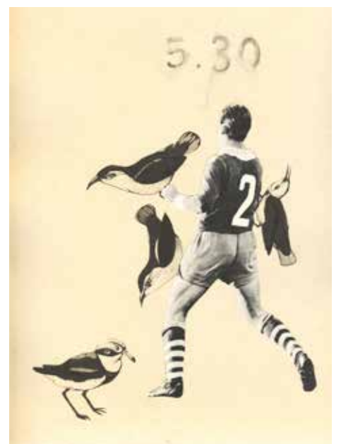
Budzik biegacza dzwoni o 5.30, czyli warszawski maratończyk o tym gdzie, jak i dlaczego biegać / The Runner's Alarm Goes Off at 5.30 am: A Warsaw Marathon Runner on Where, How and Why to Run