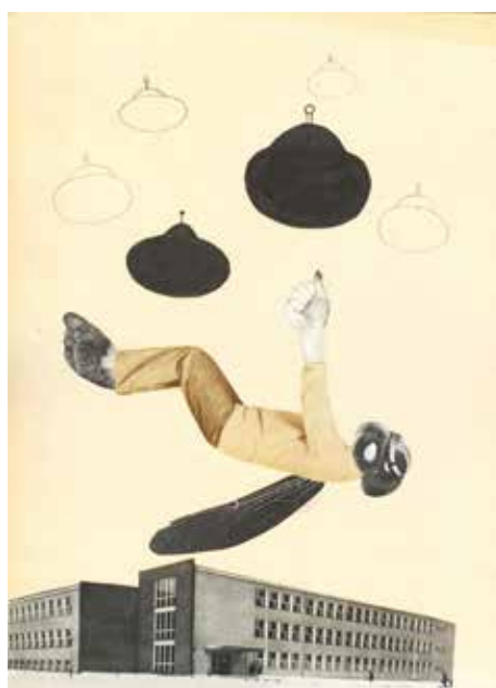
W niedzielę na Ursynowie inwazja latających talerzy / Ursynów Expects Flying Saucer Invasion Sunday