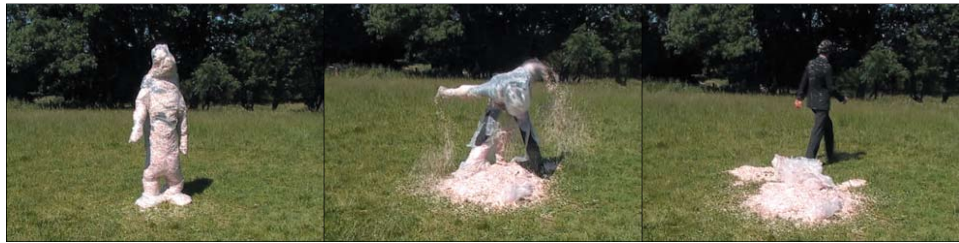
Messieurs Delmotte, Confetti's Foetus Man , 2006, wideo, dźwięk / video, son, z cyklu / cycle Unidentified Emoticon , © Messieurs Delmotte, 2006