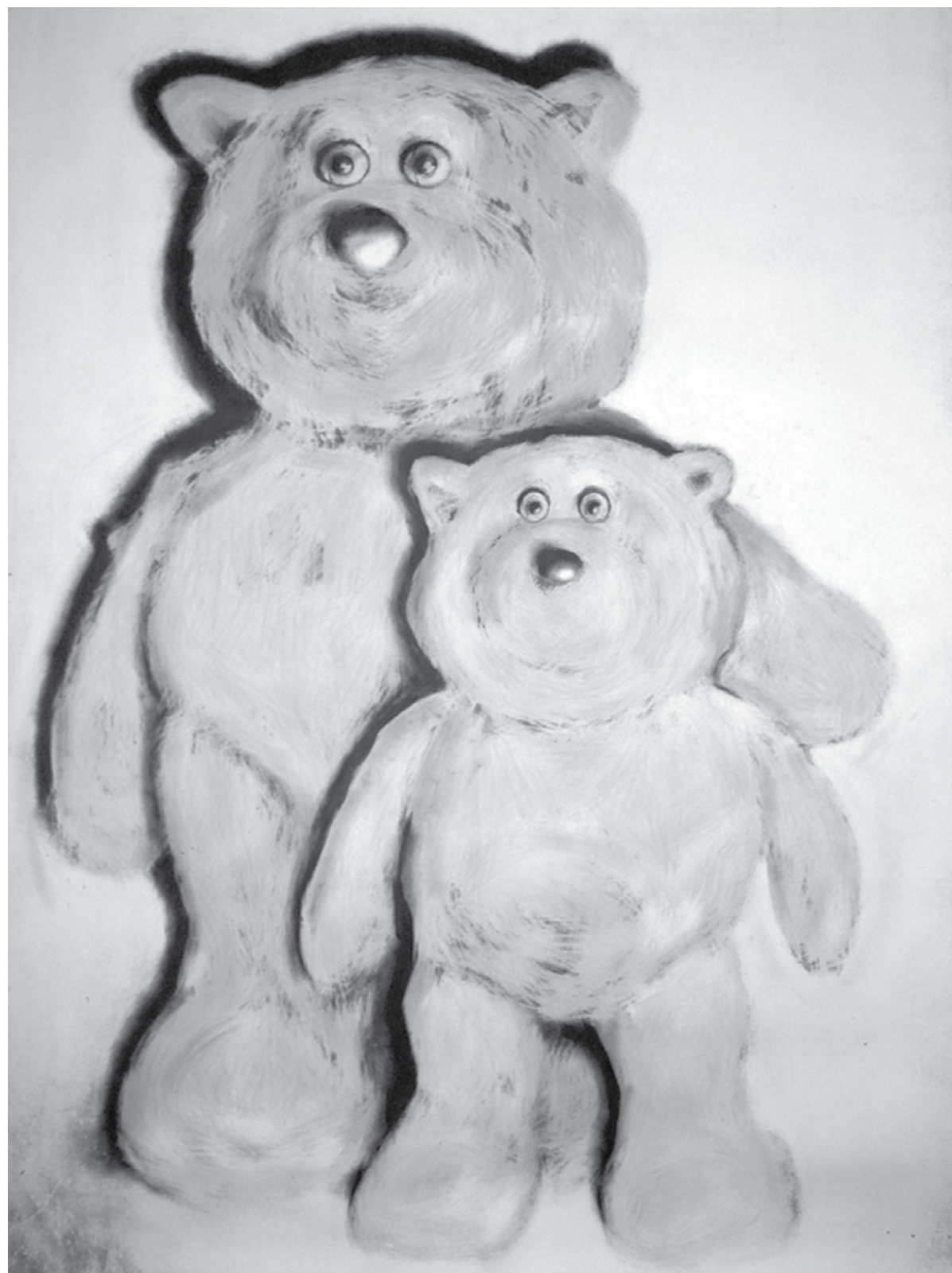
Michael Dans, bez tytułu / sans titre, 2011, tusz na papierze / encre de chine sur papier