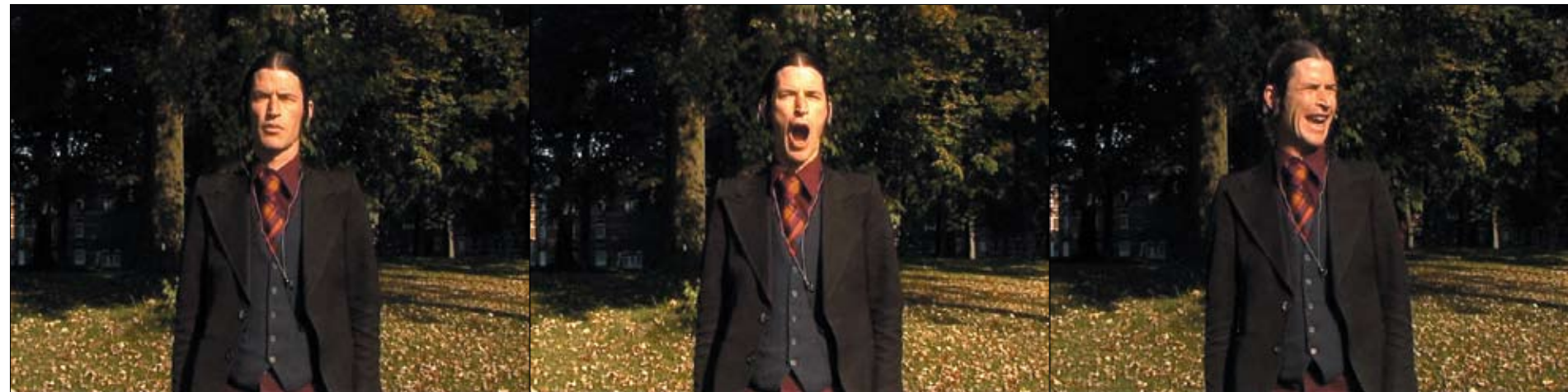
Messieurs Delmotte, Ventriloquist Bird , 2008, wideo, dźwięk / video, son, © Messieurs Delmotte, 2008